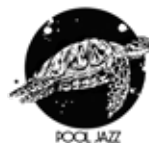
Sala Pool Jazz